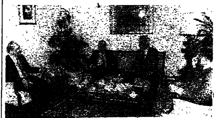
الرئيس الحسيني والنواب: مخبر، منصور والزين (اسماعيل حمدان)

التقى الرئيس حسين الحسيني امس بطبيب الكويت الدكتور منصور الزين ووزير الصحة الدكتور ابرق الى امير الكويت صباح بركة تهنئة على العيد الوطني للكويت، وعرض معهم الأوضاع الراهنة. وجه الرئيس الحسيني الى امير دولة الكويت الشيخ جابر الاحمد الصباح بكتابة تهنئة على العيد الوطني لدولة الكويت من قِبل الرئيس الحسيني في منزله مطبوع في ان يبحث في اسواقهم باسم المجلس النيابي اللبناني ويسمي باجر